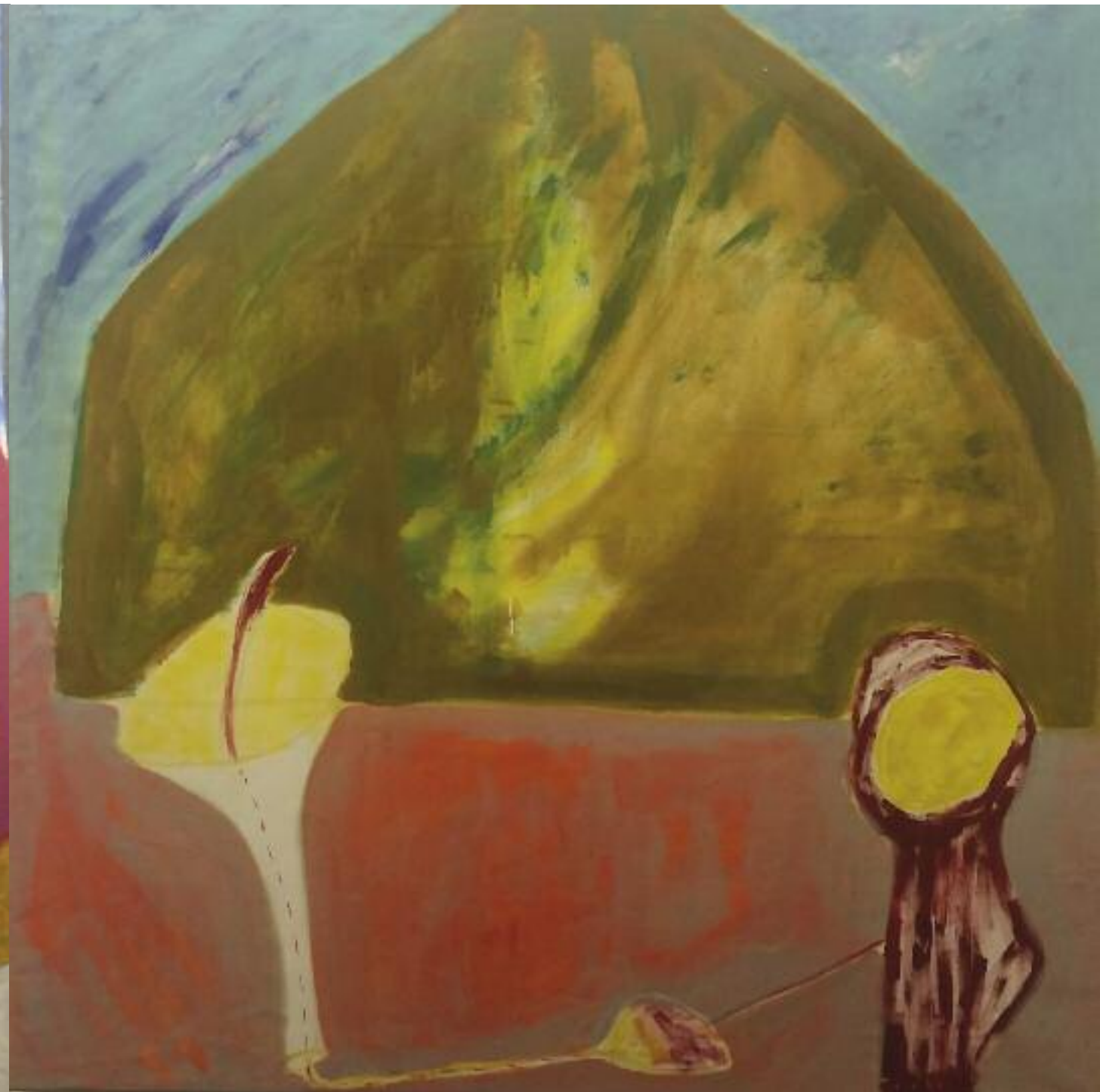
Baumgartnerhöhe Wien Viyana Acryl auf Leinwand