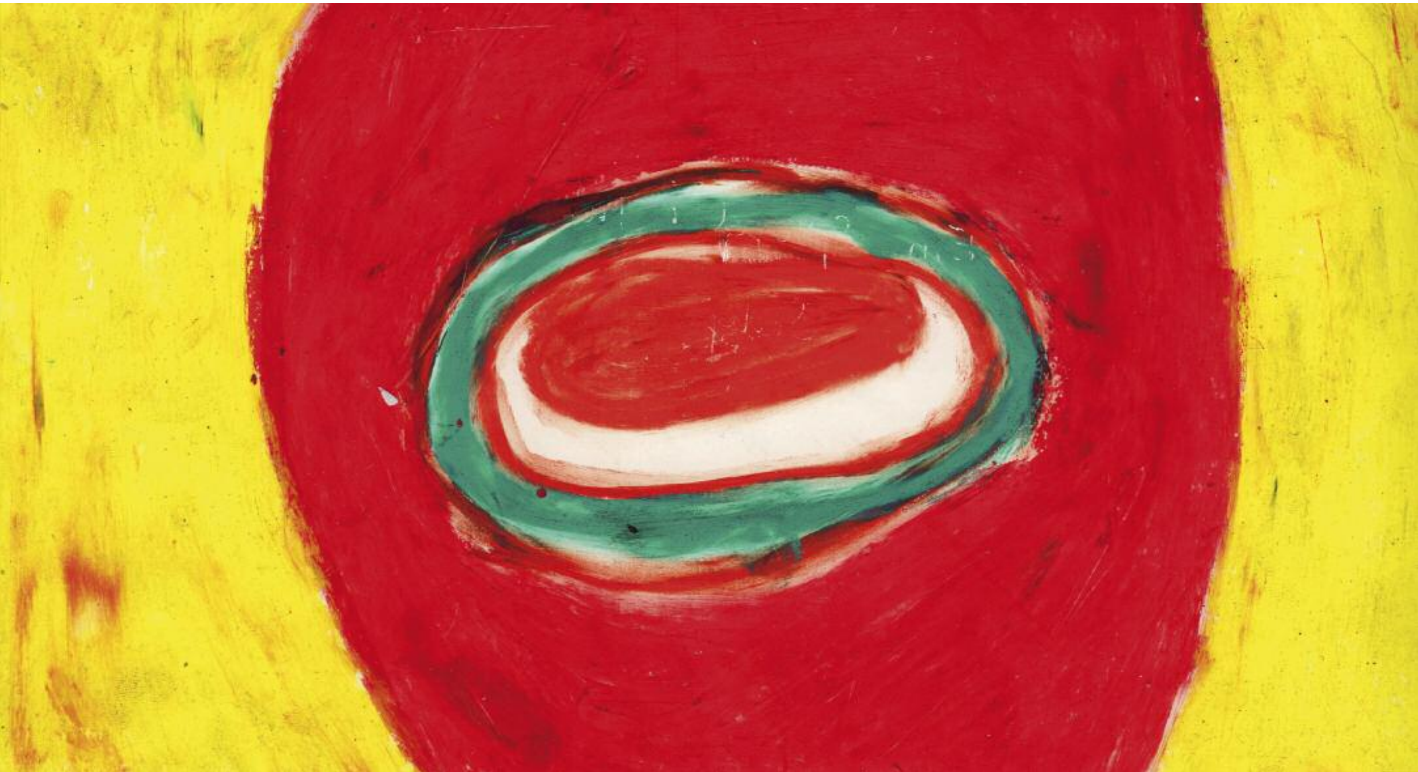
Spiegelei, Wien Sahanda yumurta, Viyana Acryl auf Leinwand

Säulen der Erinnerung - Pillars of Memory Säulen der Erinnerung - Pillars of Memory