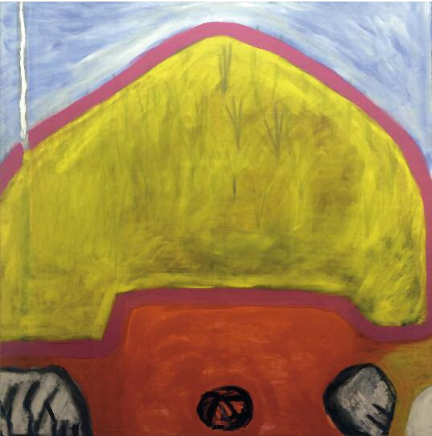
Baumgartnerhöhe Wien Viyana Acryl auf Leinwand

Säulen der Erinnerung - Pillars of Memory